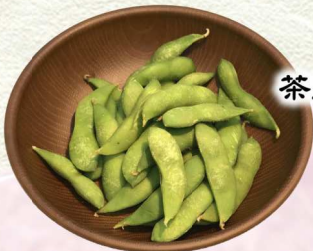
茶豆の添寝・・・¥300 - ゆで茶豆 - Boiled tea beans