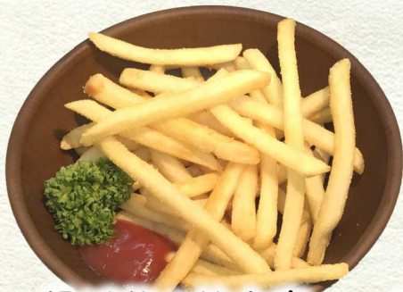
揚げ芋の雑魚寝・・・¥350