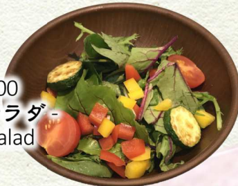
すっぴん野菜・・・¥400 - 自家製ドレッシングのサラダ - Japanese style dressing salad