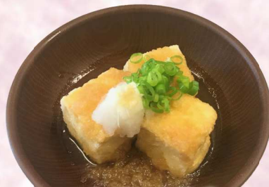
あがりゆ豆腐・・・¥350 - 揚げだし豆腐 - Deep fried tofu