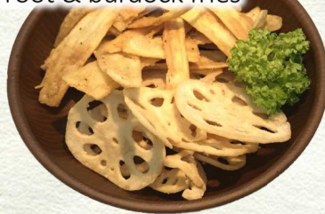
のぼせた根菜・・・¥350 - 蓮根・牛蒡チップ - lotus root & burdock fries