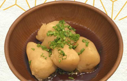
玉こんの水分補給・・・¥400 - 煮込み玉こんにゃく - Konjac