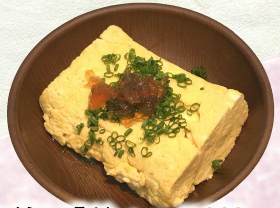
卵のだし湯治・・・¥300